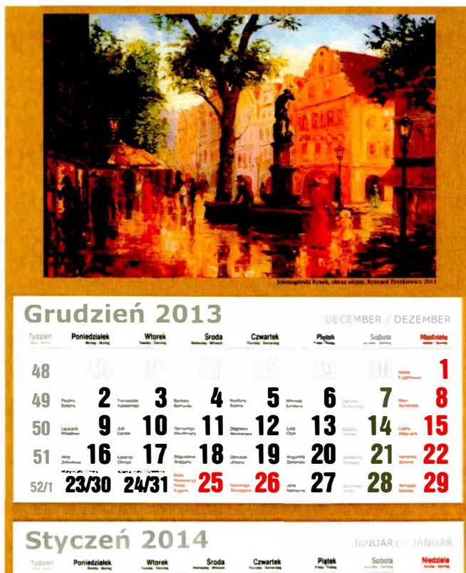
I Kalendarz 2014, Jeleniogórski rynek, olej, płótno, 2011 r., w zbiorach prywatnych