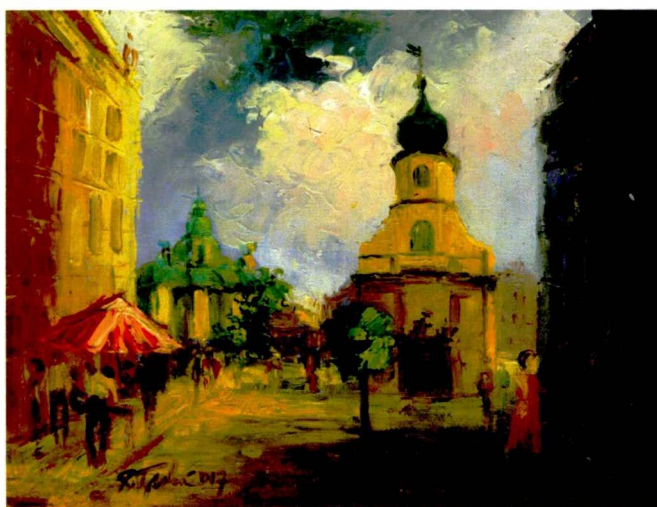
I Kalendarz 2018, Ulica 1 Maja w Jeleniej Górze, olej, płótno, 2017 r., w zbiorach prywatnych