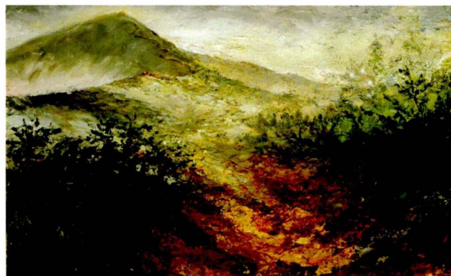
I Kalendarz 2015, Równia pod Śnieżką, olej, płótno, 2009 r., w zbiorach prywatnych