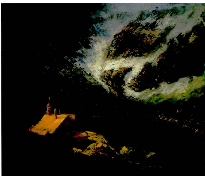
I Kalendarz 2017, Schronisko Samotnia, olej, płótno, 2016 r., w zbiorach prywatnych