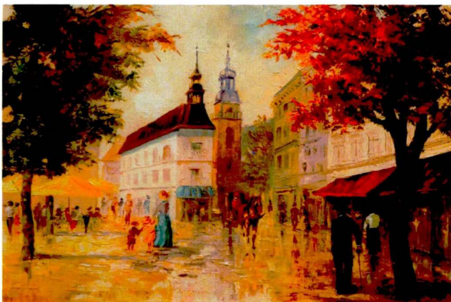
I Kalendarz 2016, Plac Piastowski w Cieplicach, olej, płótno, 2012 r., w zbiorach prywatnych