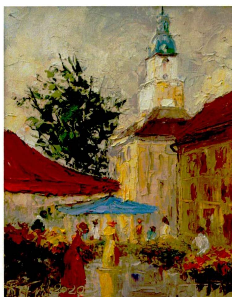
I Kalendarz 2021, Ratusz jeleniogórski, olej, płótno, 2020 r., w zbiorach prywatnych